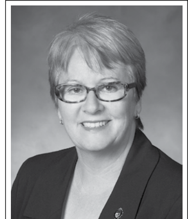
Hon Paula J. Biggar Ministre des Transports, de l'Infrastructure et de l'Énergie Ministre responsable de la Situation de la femme