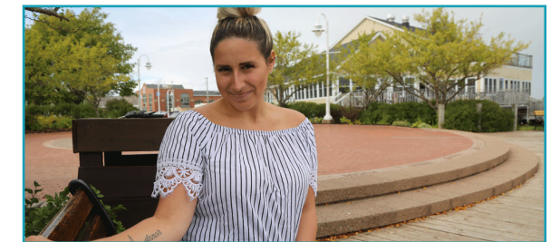
"You're not just saving the life of that one person, but you're changing the life of all the people who love them. It really is the gift of life."

People willing to donate part of their liver will undergo a surgical procedure to have up to one half of their liver removed and transplanted into a recipient in need.